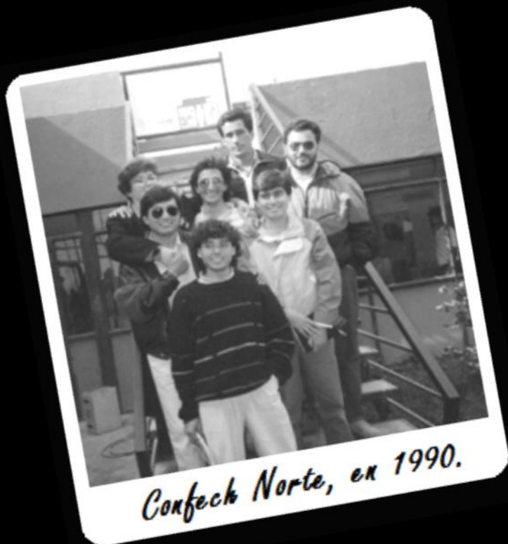
Confecch Norte, ex 1990.

En la foto aparecen dirigentes del norte, incluidos los representantes de la UNAP: