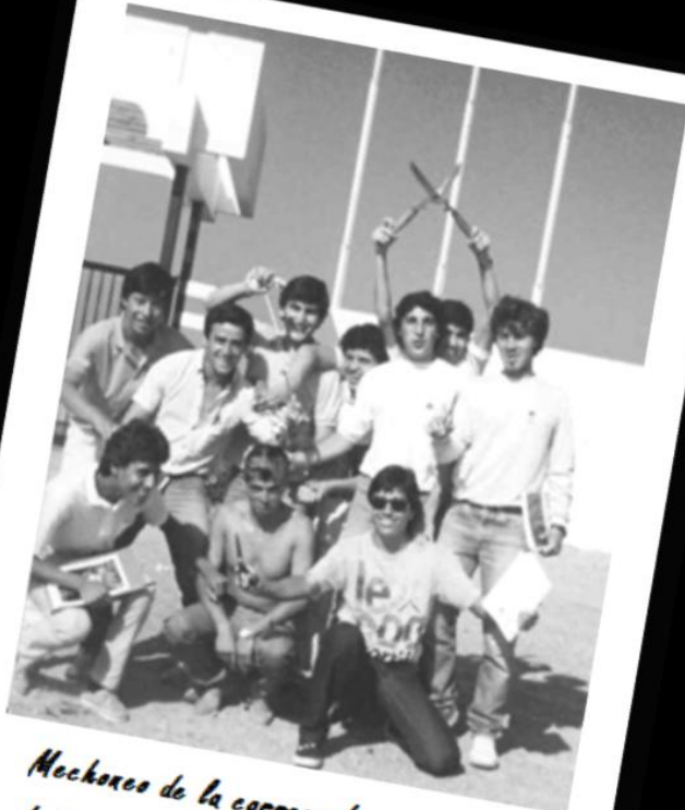
Mechoneo de la carrera Ingeniería Civil Industrial en 1987