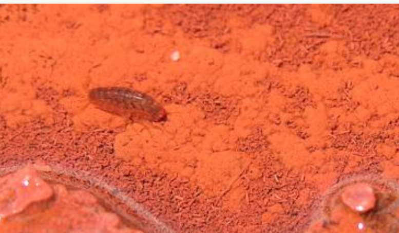
FOTO: Crustáceos anfípodos son los únicos macroinvertebrados encontrados hasta el momento en las lagunas.